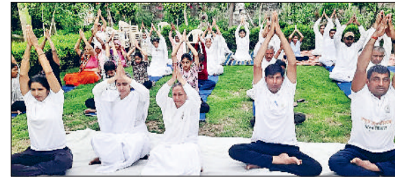
भिवानी। योगाभ्यास करते बीके भाई बहन व अन्य।

प्रशासन एवं आयुष विभाग चरखी दादरी के संयुक्त तत्वावधान में एक पृथ्वी एक स्वास्थ्य थीम पर आयोजित त्रिदिवसीय प्रोटोकॉल प्रशिक्षण में सेवाकेंद्र प्रभारी