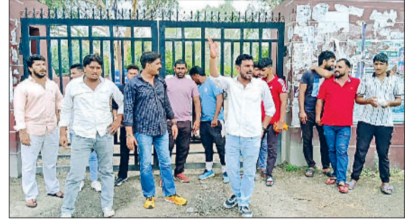
भिवानी। एचएयू में विद्यार्थियों पर लाठीचार्ज के विरोधावरूप सीबीएलयू के गेट पर तालाबंद करते हुए।