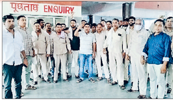
भिवानी। साथी कर्मचारी के साथ मारपीट का विरोध जताते रोडवेज कर्मचारी।

फतेहाबाद के अग्रोहा मोड़ पर रोडवेज परिचालक के साथ मारपीट के विरोध की आग भिवानी में भी सुलगने लगी। परिचालक के साथ हुई मारपीट के विरोध में मंगलवार को भिवानी के रोडवेज डिपो के कर्मचारियों ने प्रदर्शन