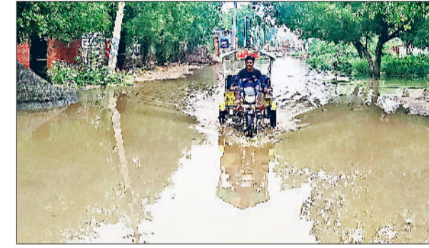
बहल। कस्बे के वाई नंबर 7 ढाणी मेचू में रास्ते पर जमा हुआ बारिश का पानी।

सोमवार रात हुई बारिश से कस्बे में अनेक जगहों पर पानी भर गया, जिससे लोगों को आवागमन में भारी परेशानी का सामना करना पड़ा। कुछ जगहों पर तो सोमवार दिन में हुई बारिश का पानी ही नहीं निकला था कि रात को हुई बारिश से अनेक जगहों पर फिर पानी जमा हो गया। कस्बे के वाई सात (ढाणी मेचू) में इतना पानी भर गया कि लोगों को निकलने तक का रास्ता नहीं मिला। बीडीपीओ कार्यालय से लेकर ढाणी मेचू तक पानी की झील जैसा नजारा दिखाई दिया। लोहारू रोड से ढाणी